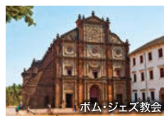
ボム・ジェズ教会

インド西海岸の美しいビーチリゾート。ポルトガル統治時代の面影が残り、フランシスコ・ザビエルの聖遺物が納められているボム・ジェズ教会などの文化遺産も見どころです。