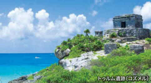
トゥルム遺跡(コズメル)