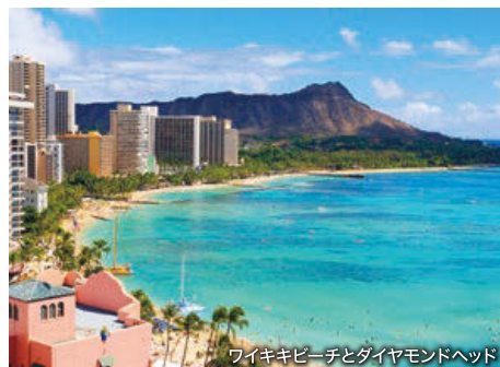
ワイキキビーチとダイヤモンドヘッド