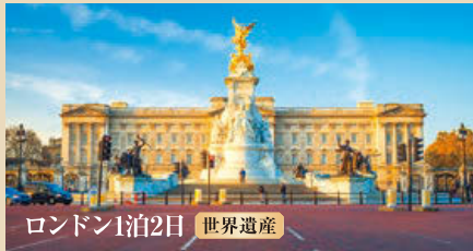
ロンドン1泊2日 世界遺産