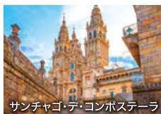
サンチャゴ・デ・コンポステーラ