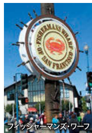
フィッシャーマンズ・ワーフ

赤い橋ゴールデンゲートブリッジがシンボルの風光明媚な街で、坂が多い市街では路面電車が走ります。フィッシャーマンズ・ワーフなどの名所のほか、カリフォルニアワインの産地ナパバレーへも訪れていただけます。