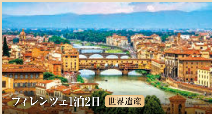
フィレンツェ1泊2日 世界遺産