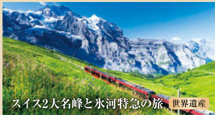
スイス2大名峰と氷河特急の旅 世界遺産