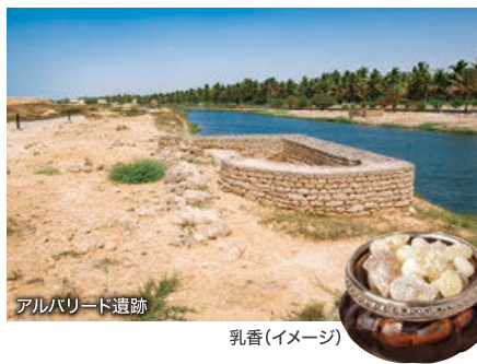
アルバリード遺跡