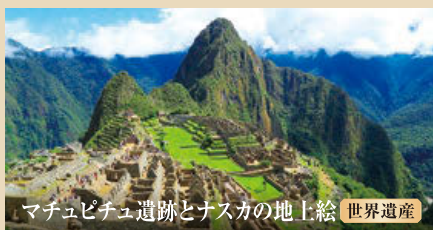
マチュピチュ遺跡とナスカの地上絵 世界遺産