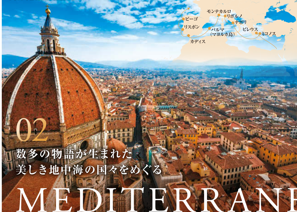
フィレンツェの街並み(リボルノ)