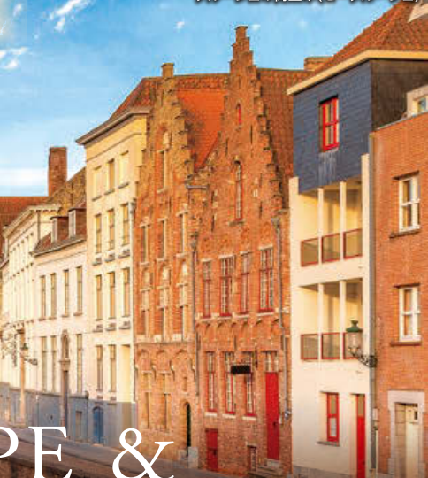
ブルージュの街並み(ゼーブブルージュ)