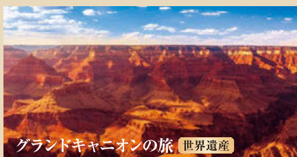
グランドキャニオンの旅 世界遺産