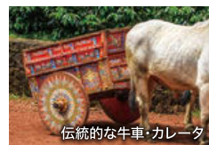
伝統的な牛車・カレータ

国土の4分の1が国立公園に指定されているコスタリカは、エコツアーリズム先進国。熱帯の植物園ではネイチャーツアーが開催され、ゴンドラで熱帯雨林を遊覧することもできます。高原都市サン・ホセへの観光もおすすめです。