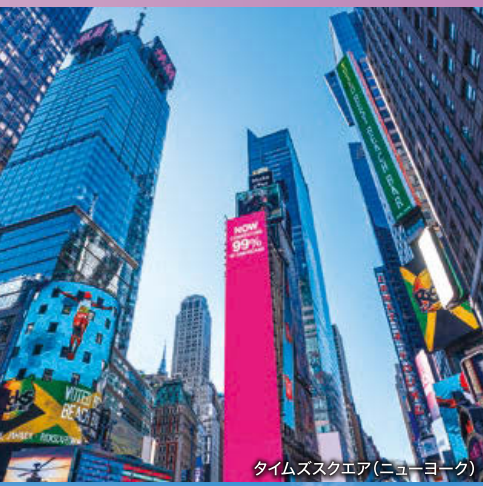
タイムズスクエア(ニューヨーク)