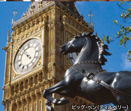
ビッグ・ベン(テイルベリー)