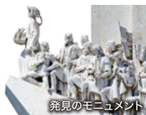
発見のモニュメント