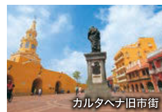
カルタヘナ旧市街

16世紀にスペインによって築かれ、金や銀、宝石などの貿易で栄えた古都。石の城壁に囲まれた旧市街には当時のままコロニアル様式のカラフルな街並みが広がり、世界遺産に登録されています。