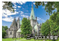
ニードロス大聖堂

ノルウェー王国の最初の首都で歴史的建造物が数多く残るトロンハイムは、現在は大学や研究施設が集まる学問の街。荘厳なニードロス大聖堂や、昔ながらの可愛らしい家々が建ち並ぶ旧市街で自由散策をお楽しみください。