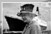
命名されたエリザベス女王