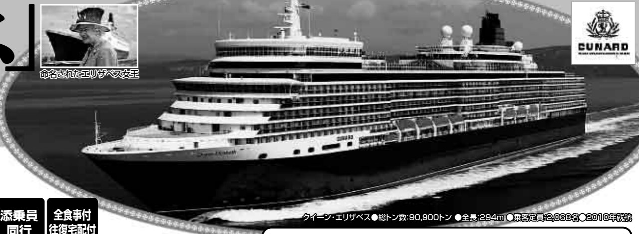
クイーン・エリザベス ●総トン数:90,900トン ●全長:294m ●乗客定員:2,068名 ●2010年就航

羽田発 / 成田着 旅情あふれる水の都ベニスから — ベストシーズンのエーゲ海 — コルチュラ・クレタ・ロードス・ボロス・ミコノス 輝きの島々を巡る