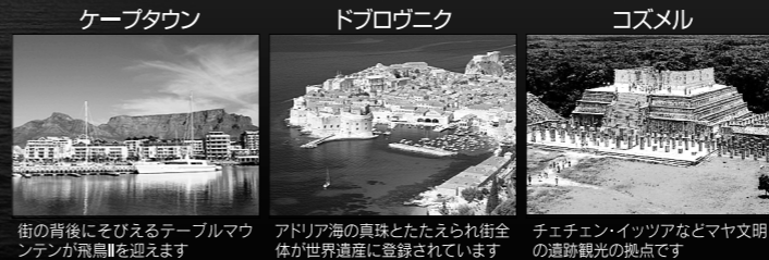
街の背後にそびえるテーブルマウンテンが飛鳥IIを迎えます アドリア海の真珠とたたえられ街全体が世界遺産に登録されています チチェン・イツツァンなどマヤ文明の遺跡観光の拠点です