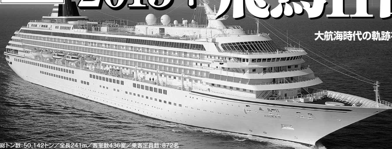
総トン数:50,142トン/全長241m/客室数436室/乗客定員数:872名