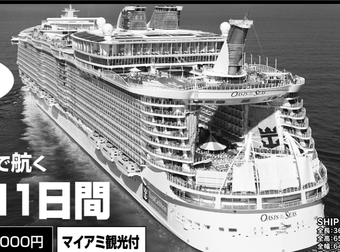
SHIP DATA 全長:360メートル 全幅:65メートル 全幅:66メートル 乗客定員:5,400人