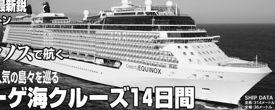
SHIP DATA 全長:314メートル 全幅:36メートル 乗客定員:2,850人