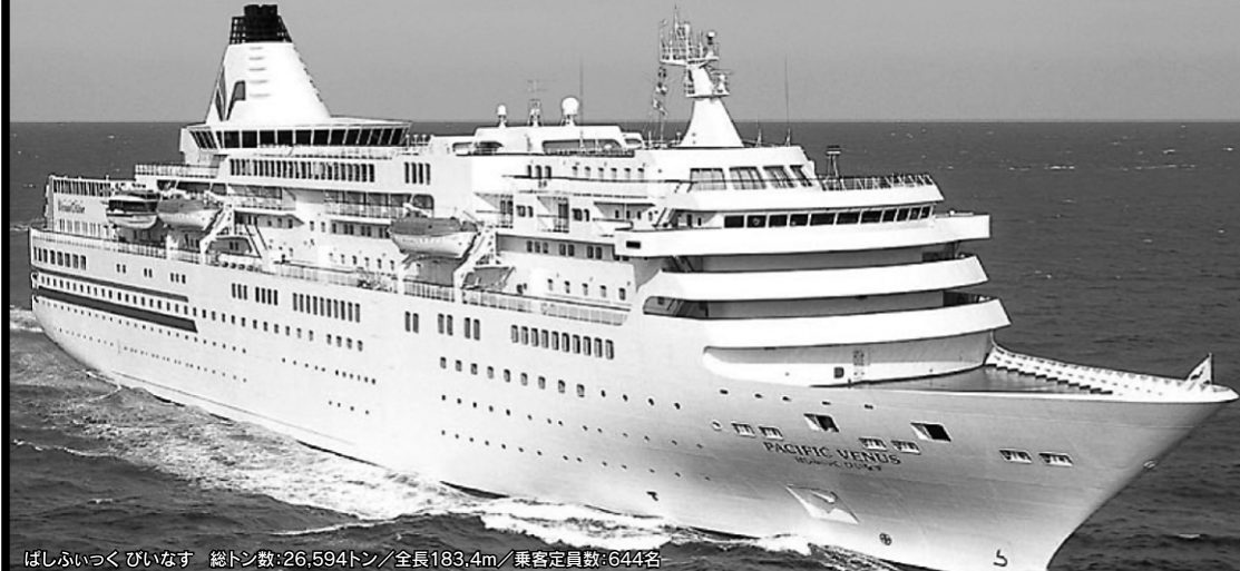
ぱしふいっくびいなす 総トン数:26,594トン/全長183.4m/乗客定員数:644名