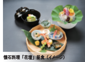
懐石料理「花壇」昼食（イメージ）

※オプションツアーは商船三井客船の旅行企画・実施となります。 ※上記の金額は大人お一人様の料金です。上記は一例で他にもコースがございます。 ※具体的な内容とお申込方法は別途ご案内します。