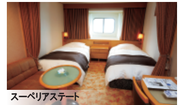
スーペリアステート