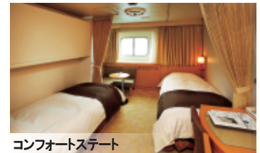
コンフォートステート