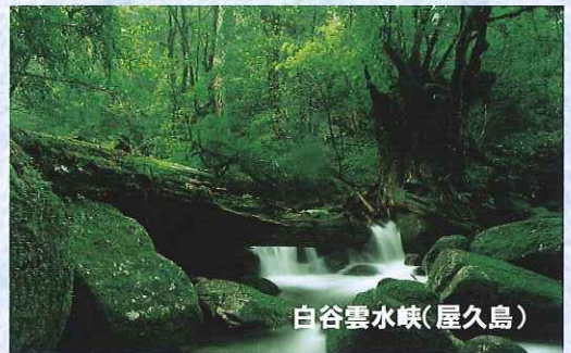
白谷雲水峡(屋久島)