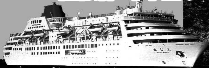
●ふじ丸：総トン数：23,235トン／船客定員：600名