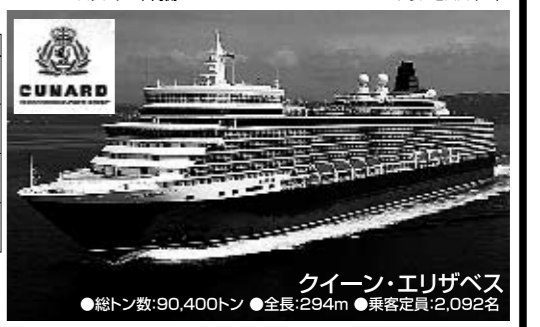
クイーン・エリザベス ●総トン数:90,400トン ●全長:294m ●乗客定員:2,092名

※( )内は船室及びホテルを1人独占利用の追加料金。 ※客室クラスによってはお取りできない場合があります。 詳しくはお問い合わせください。