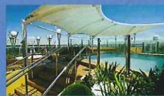
展望ラウンジやザ・ワン・プールなどのプライベートエリア

フレンチレストラン「レトワール」、地中海料理「ロリーヴォ」のお食事を無料でご堪能いただける他、ヨットクラブエリア外にある専用スペースでもお食事ができます。お飲み物の無料サービスもご用意。