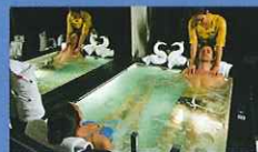
MSCアウレア・スパ(専用エレベーター完備)

MSCヨットクラブ専用プールを完備。優雅な船旅を、より快適にお過ごしいただけます。