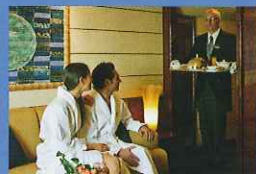
24時間のバトラーサービス、専用コンシェルジュサービス

プライベート・バルコニー付もしくは眺望を楽しめる窓付の、イタリア風デザイナー・スイートを99室設置。全室にウォークインクローゼット、完全無料のミニバー、LCDスクリーン等の充実した室内設備が自慢です。