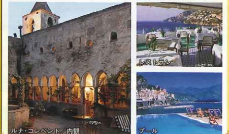
ルナ・コンベント内観 プール

アマルフィの町の中心地から徒歩5分、アマルフィ海岸の断崖絶壁に建つホテルです。目の前に広がる海、夜にはロマンティックな街の明かりを眺めることのできる絶好のロケーションです。13世紀には修道院として使われていたため、その名残があちこちにありま。ホテルの中心にはレモンの樹、また室内は南イタリアらしい明るい作りで、優雅なアマルフィ滞在をお楽しみ頂きます。