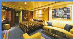
豪華スイートルーム99室

プライベート・バルコニー付もしくは眺望を楽しめる窓付の、イタリア風デザイナー・スイートを99室設置。全室にウォークインクローゼット、完全無料のミニバー、LCDスクリーン等の充実した室内設備が自慢です。