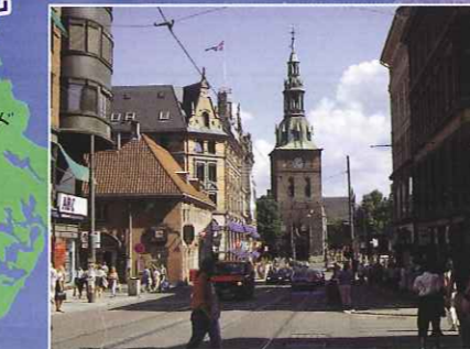
■オスロ オスロ湾に面し、フィヨルドを見下ろして広がるノルウェーの首都。画家ムンクや劇作家イブセンを生んだ芸術と文化の街として知られています。