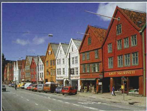
■ベルゲン ノルウェー第二の都市にして最大の港町ベルゲン。12~13世紀は首都として、またその後も商業の中心地として栄え、今もなお中世の面影残る、旅愁漂う街です。