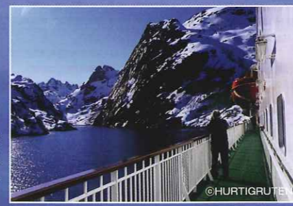
■ロフォーテン諸島 複雑に入り組んだ小島と入り江が連なっており、船上からはダイナミックで美しい景観がお楽しみいただけます。