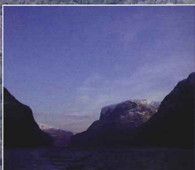
■ソグネフィヨルド 全長約205km、最も深い部分で約1308mと世界最長にして最深のソグネフィヨルド。雪解けの水がくり出す名もない無数の滝がごろごろと音を立ててフィヨルドに流れ込む様子は圧巻です。