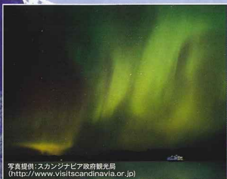
■スヴォルヴァー ロフォーテン諸島最大の港町、切り立った山々や、入り組んだ入り江など、「絵はがきの中に入っている」と言われるほど美しい景色をもっています。