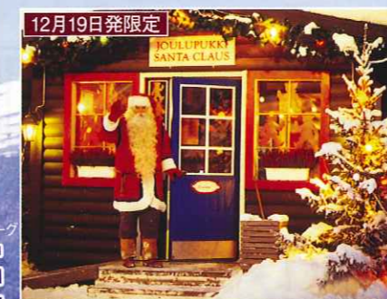
12月19日発限定 ■サンタクローズ村(ロヴァニエミ) フィンランドの州都ロヴァニエミの近郊にある村。サンタの家やサンタ郵便局などが集まったサンタクローズ村があり、土産物屋や記念スタンプ付きの手紙を発送してくれます。