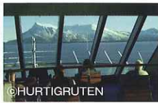
パノラマラウンジ