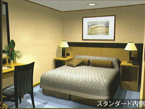
スタンダード内側