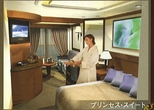
プリンセス・スイート

※上記の写真はイメージです。上記キャビン写真は、クイーン・ヴィクトリアのキャビンです。間取り・広さ・デザインなどが若干異なります。