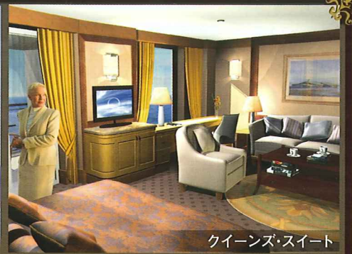
クイーンズ・スイート