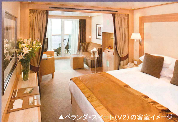
▲ベランダ・スイート(V2)の客室イメージ