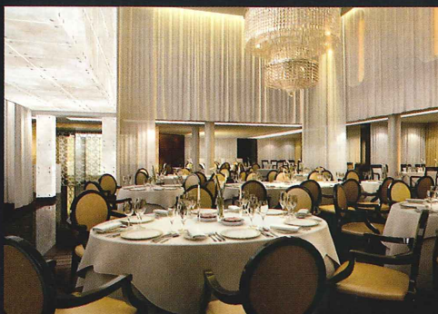
▲メインダイニング