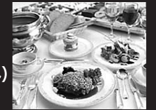
※イメージ/当日のメニューと異なる場合があります。

要予約 お申し込み方法: 下記フリーダイヤルにお申し込みください。 ※20歳未満のお客様のご参加はご遠慮いただいております。