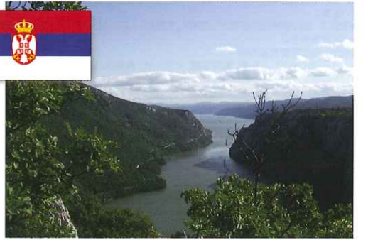
鉄門 セルビア共和国

「ドナウの真珠」と称されるハンガリーの首都。街はブダペストの2つに分けられ、ブダ側にはドナウ河畔にそびえる王宮の丘が長さ1.5kmにも連なります。宵間に浮かび上がる「くさり橋」の夜景も見事です。