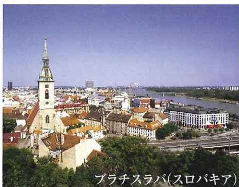
ブラチスラバ(スロバキア)