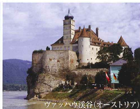
ヴァッハウ渓谷(オーストリア)

ヨーロッパトップクラスを誇り、きめ細かいサービスと上質の食事で定評があるリバークルーズ会社ユニワールド社の「リバー・ダッチェス号」に乗船。アムステルダムからルーマニアの黒海近辺の街ギルギユまで、ヨーロッパ9カ国を大横断する壮大なクルーズです。ライン河、メイン河、ドナウ河などは古くからヨーロッパ大陸の交通手段として利用され、沿岸の街は古くから栄えていました。それぞれの国、言語、民族、文化などの違いを比べてみると、旅行の楽しさも一層豊かなものになるでしょう。河船ですので揺れも少なく、両側にのどかな田園風景や歴史ある街並み、かつてドナウ河一の難所だった鉄門峡谷などをのんびり眺めながら船は進んでいきます。日本の旅行会社では、ゆたか倶楽部が初めて催行した実績があり、毎回大好評のリバー・クルーズ。今回で8回目を迎えます。