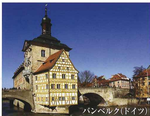
バンベルク(ドイツ)

2010年6月20日(日)～7月17日(土) 1,458,000円～1,768,000円