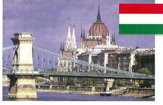
ブダペスト ハンガリー

「音楽の都」「楽都」とも呼ばれ、かつてヨーロッパ数カ国を支配したハプスブルク家の栄華を伝えるオーストリアの首都。シュテファン寺院や旧市街を含む「ウィーン歴史地区」は世界遺産に登録されています。