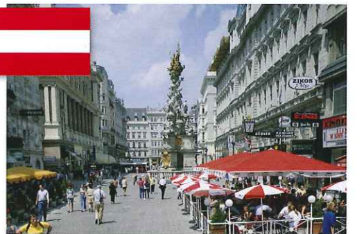
ウィーン オーストリア

街の名は古代ローマ帝国がここを植民地(コロニア)にしていたことに由来する、ドイツ第4の都市。街のシンボルである「ケルン大聖堂」はゴシック様式として世界最大の建築物です。