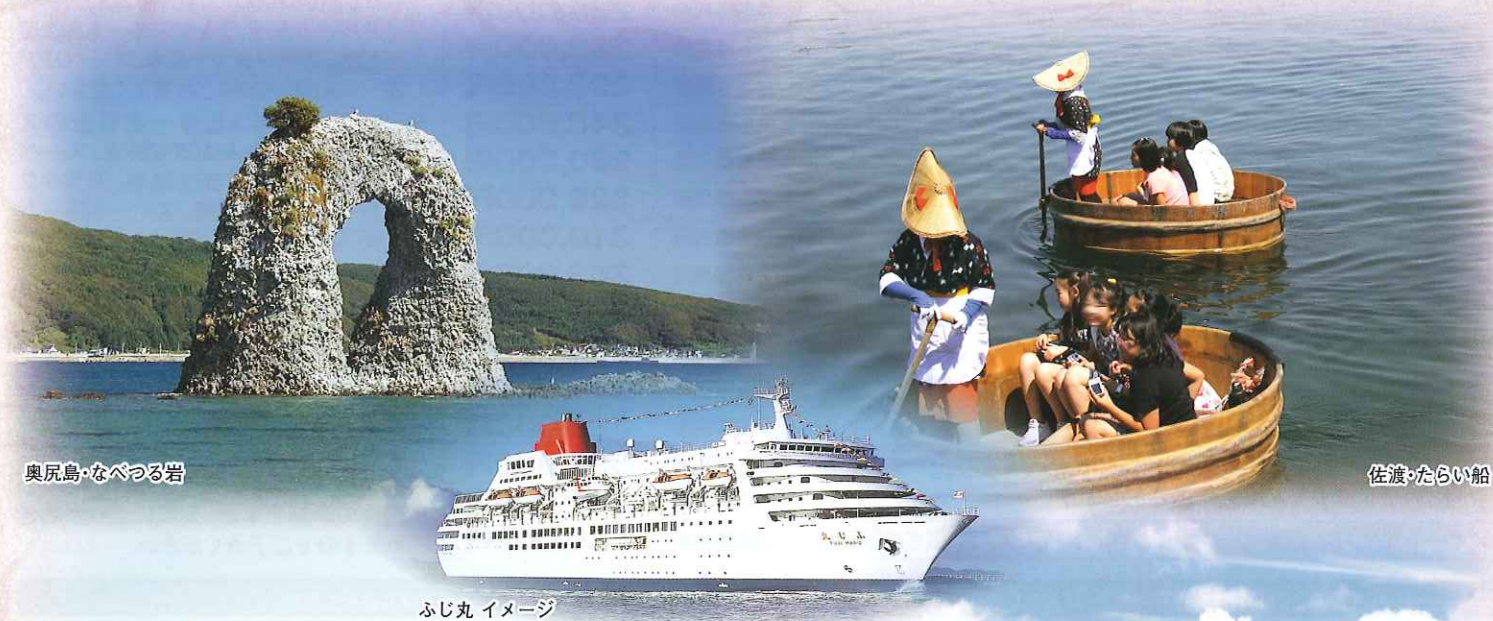
奥尻島・なべつる岩

日本船としては初めて日本海の四島を一回のクルーズで巡ります。 奥尻地震の青苗、さくらがちょうど満開の佐渡、後鳥羽天皇が流された隠岐の島、 壱岐の元寇遺跡、そして海の幸を心ゆくまでご堪能ください。