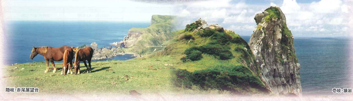
隠岐・赤尾展望台