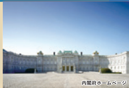
内閣府ホームページ

※国公賓等の接遇その他迎賓館の運営上の都合により公開が中止となる場合がございます。