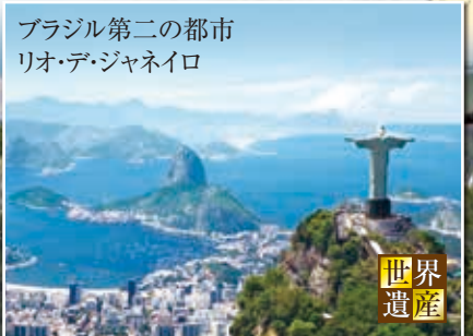
ブラジル第二の都市 リオ・デ・ジャネイロ