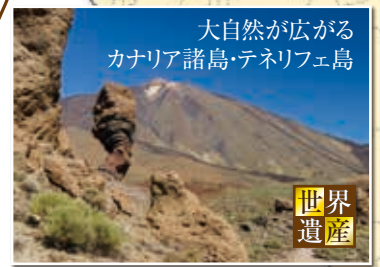
大自然が広がる カナリア諸島・テネリフェ島