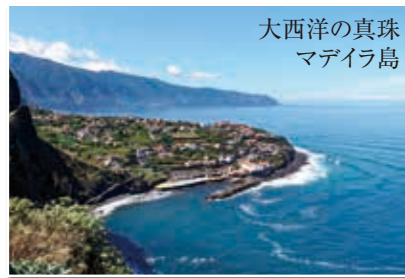
大西洋の真珠 マデイラ島

イタリア・ジェノバから出航、マルセイユやバルセロナなど地中海の人気都市に寄港。 さらに大西洋の真珠マデイラ島と大自然が残るカナリア諸島のテネリフェ島を訪れます。その後、大西洋を横断し南米大陸へ。 ブラジルのリオ・デ・ジャネイロで下船、世界三大瀑布のイグアスの滝をお楽しみください。