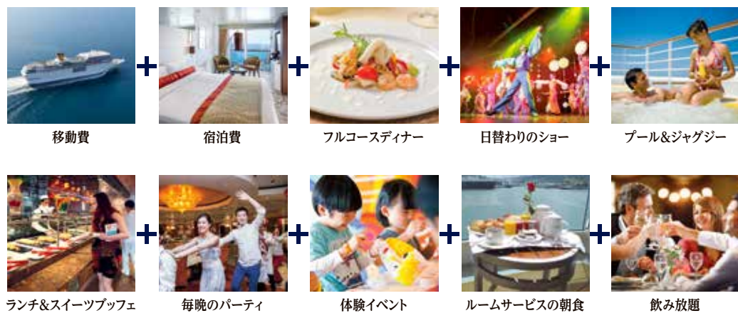
移動費 宿泊費 フルコースディナー 日替わりのショー プール&ジャグジー ランチ&スイーツbuffet 毎晩のパーティ 体験イベント ルームサービスの朝食 飲み放題

「移動費+宿泊費+飲食+娯楽」のすべてがセットになって、食事は食べ放題。ショーやイベント、プールやジムも無料です。クルーズは、通常の旅行より、はるかにコスパがいんです。