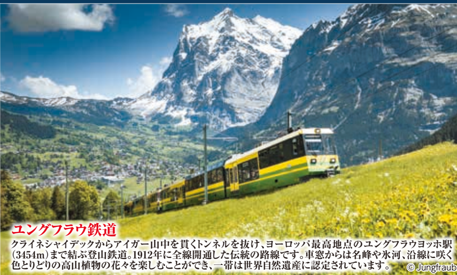
ユングフラウ鉄道

ユングフラウ鉄道で、世界遺産のヨーロッパアルプスへ。 スイスを代表する名峰アイガー、メンヒ、ユングフラウが連なる、壮大な眺めをご覧ください!