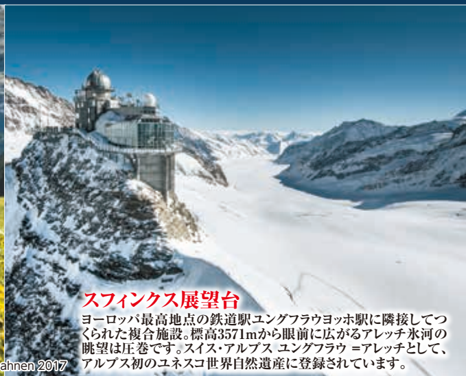
スフィンクス展望台

クライネシャイデックからアイガー山中を貫くトンネルを抜け、ヨーロッパ最高地点のユングフラウヨッホ駅(3454m)まで結ぶ登山鉄道。1912年に全線開通した伝統の路線です。車窓からは名峰や氷河、沿線に咲く色とりどりの高山植物の花々を楽しむことができ、一帯は世界自然遺産に認定されています。