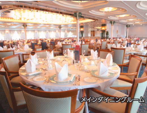
メインダイニングルーム