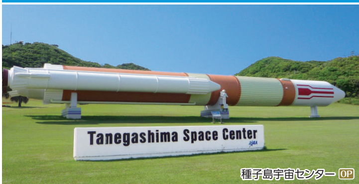
種子島宇宙センター OP

鉄砲伝来の地として歴史に残り、日本唯一の実用衛星の打ち上げが行われている「種子島宇宙センター」がある歴史と科学が共存する島です。