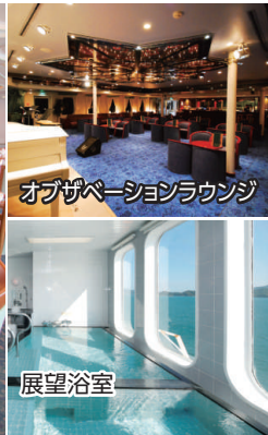
オブザベーションラウンジ