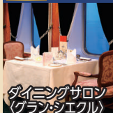
ダイニングサロン (グラス・エクリ)

◆専用ダイニングで専属シェフによる特別なメニューときめ細やかなサービスでおもてなし。二人掛けテーブルでゆったりとお食事をお楽しみいただけます。 ※ダイニングサロンは未就学児童の方はご利用いただけません。 ◆乗船日にはお部屋にウェルカムスイーツをお届けします。