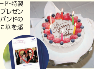
記念写真 (特製フォトフレーム付)