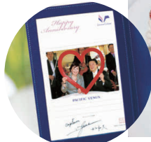
記念写真 (特製フォトフレーム付)