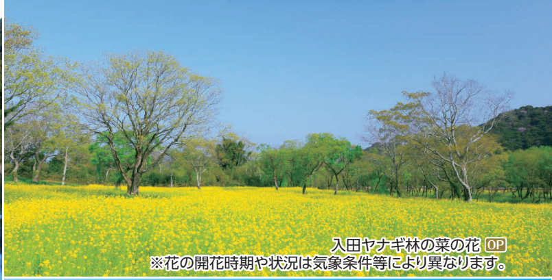
入田ヤナギ林の菜の花 OP ※花の開花時期や状況は気象条件等により異なります。