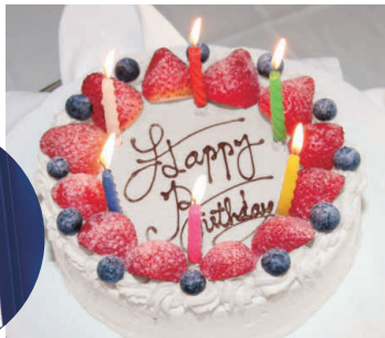
パティシエ特製 バースデーケーキ