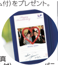
記念写真 (特製フォトフレーム付)