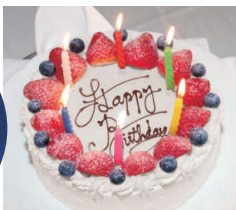
パティシエ特製バースデーケーキ