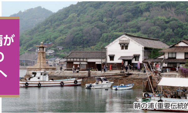
鞆の浦(重要伝統的建造物群保存地区)