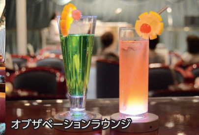
オブザベーションラウンジ