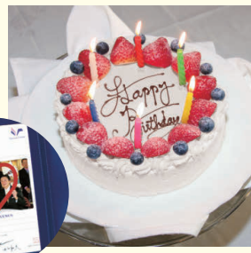
記念写真 (特製フォトフレーム付)