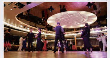
社交ダンスタイム