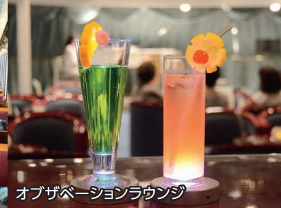
オブザベーションラウンジ