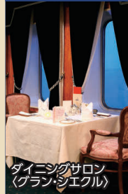
ダイニングサロン (グラン・シエクル)