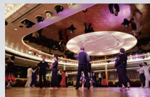
社交ダンスタイム