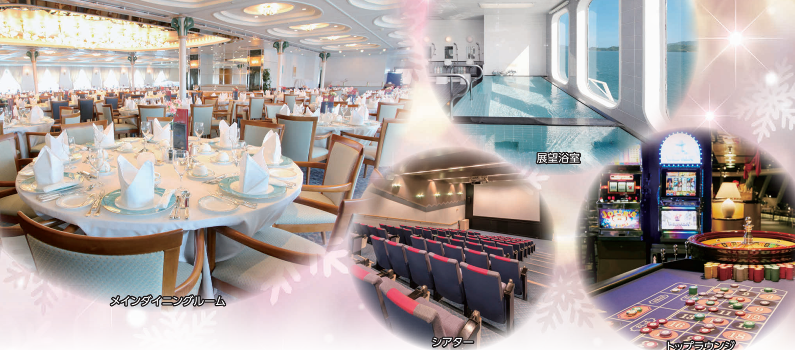
メインダイニングルーム