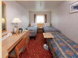
▲3名利用(ソファベッド使用例)

定員 E:2名 F~J:2~3名(15.3㎡ シャワートイレ付) ※H・Jは丸窓 E:9階 F:8階 G:6階 H:6・5階 J:5階