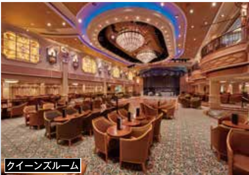
クイーンズルーム