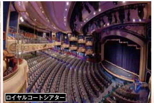
ロイヤルコートシアター