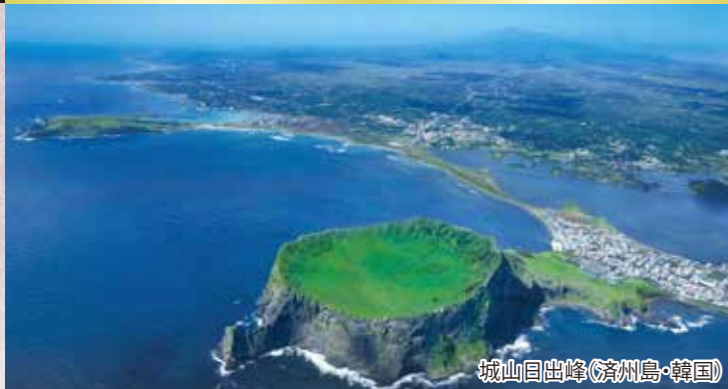
城山日出峰(濟州島・韓国)

春の山陽、九州、四国の各地をめぐり、韓国のリゾート地で知られる濟州島を巡る2020年クイーン・エリザベス横浜発着クルーズの最初のクルーズです。終日航海も3日間あり、船内でもゆっくりお過ごしいただくことができます。