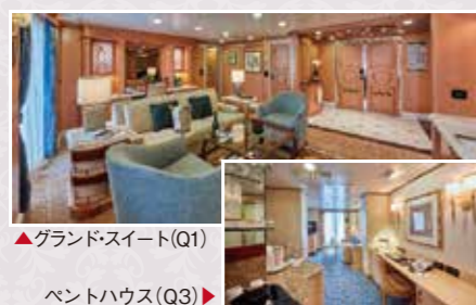
▲グランドスイート(Q1)