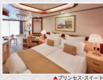
▲プリンセススイート