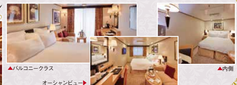
▲バルコニークラス