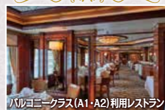
▲バルコニークラス(A1・A2)利用レストラン