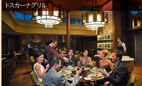
トスカーナグリル