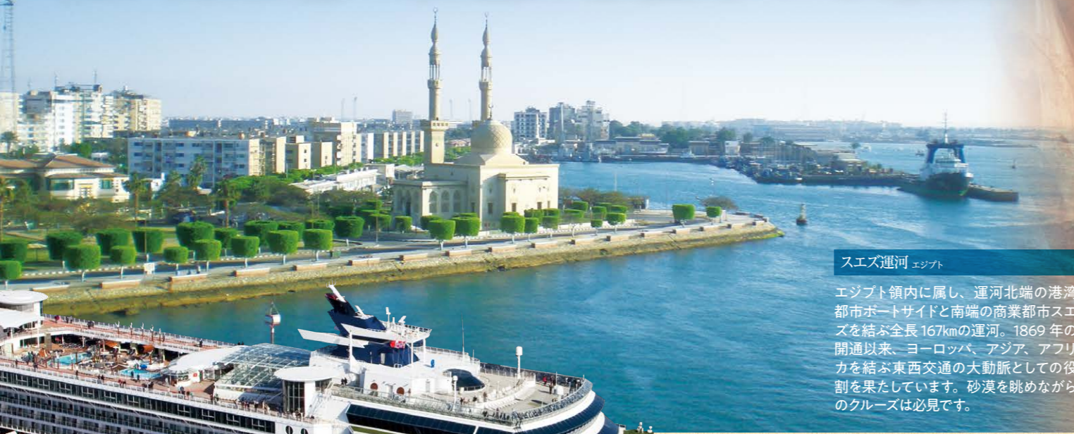
スエズ運河 エジプト

エジプト領内に属し、運河北端の港湾都市ポートサイドと南端の商業都市スエズを結ぶ全長167kmの運河。1869年の開通以来、ヨーロッパ、アジア、アフリカを結ぶ東西交通の大動脈としての役割を果たしています。砂漠を眺めながらのクルーズは必見です。