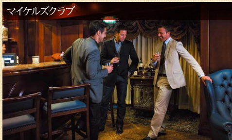
マイケルズクラブ