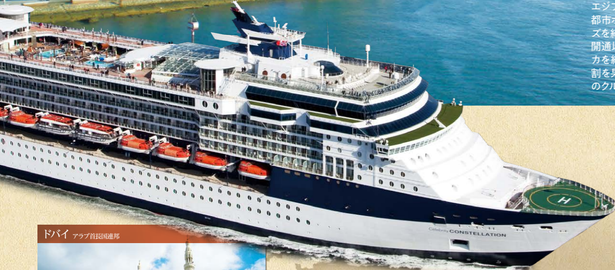
ドバイ アラブ首長国連邦

ギリシャ語で崖を意味し、アラブ人の一族ナバテア人が切り立つ崖壁を削り大都市を建てたと言われる謎に満ちた世界遺産。映画「インディージョーンズ」でも有名になった景色は壮大です。