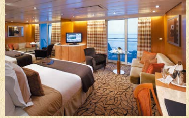
広さ：約 23.3㎡、ベランダ：約 5.2㎡