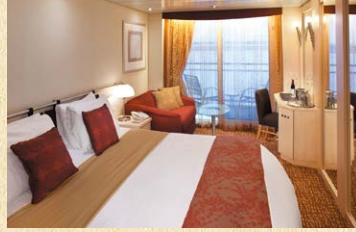
広さ：約 15.7㎡、ベランダ：約 3.5㎡