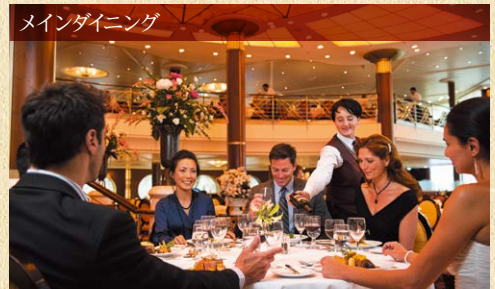
メインダイニング