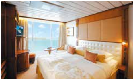
C: バルコニー・ステートルーム (22.2㎡)バスタブ・バルコニー付