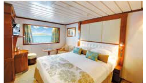
E: ウィンドウ・ステートルーム (18.6㎡)バスタブ付

※客室のデザイン・レイアウトなどは画像と若干異なる場合がございます。 ※バスタブなしの客室になる場合がございます。