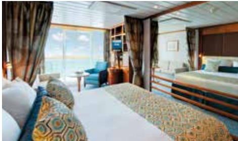
B: ベランダ・ステートルーム (28.1㎡~28.3㎡)バスタブ・バルコニー付