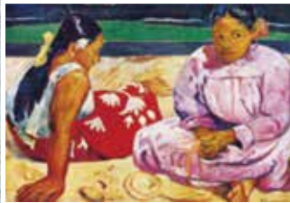
タヒチの女(浜辺にて) オルセー美術館蔵

パリで生まれたゴーギャンが、西洋文化に絶望し、楽園を求めて訪れたのが南太平洋にあるタヒチ島でした。タヒチで描かれた多くの絵画は、赤を多く使った明るい色をメインにし、原始的・神秘的な絵画を色で表現しています。タヒチの自然やタヒチで出会った女性をモチーフに描いた作品が今もなお代表作として残されています。