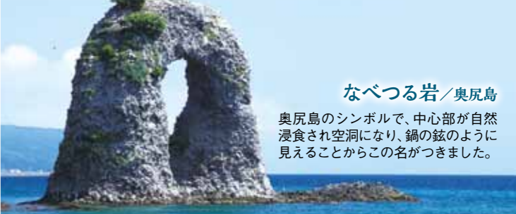
なべつる岩/奥尻島 奥尻島のシンボルで、中心部が自然浸食され空洞になり、鍋の鉉のように見えることからこの名がつけました。