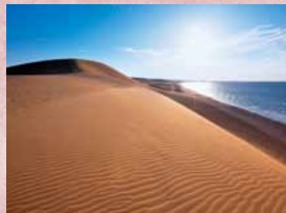
鳥取砂丘 西16km、南北2kmで、日本一のスケールを誇る鳥取砂丘。大自然の生み出すアートをお楽しみください。