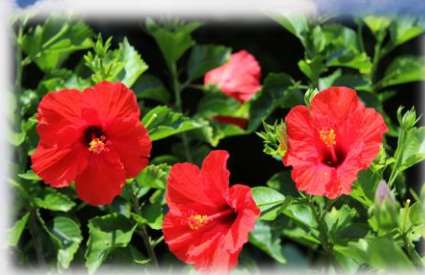
■ハイビスカス