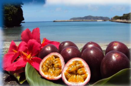
■パッションフルーツ

東京都では、幅広く都民の皆様にクルーズを楽しんでいただき、東京港をより身近に感じていただくために、通常代金よりも低廉な価格を設定した「東京都民クルーズ」を実施しています。今回は、日本クルーズ客船㈱・クルーズのゆたか倶楽部から、「夏の世界自然遺産 小笠原クルーズ」をご案内します。この機会にクルーズを体験してみませんか? 応募方法やコース詳細は裏面をご覧ください。