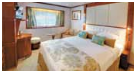
E:ウィンドウ・ステートルーム (18.6㎡) バスタブ付

※客室のデザイン・レイアウトなどは画像と若干異なる場合がございます。 ※バスタブなしの客室になる場合がございます。