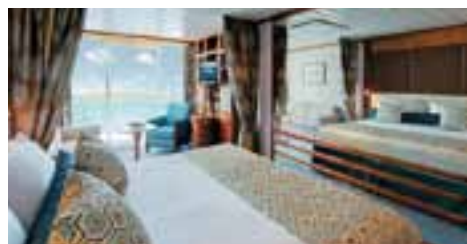
B:ベランダ・ステートルーム (28.1㎡~28.3㎡) バスタブ・バルコニー付