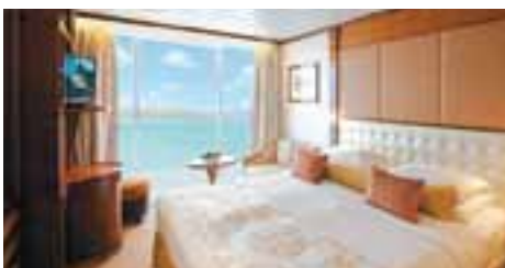
C:バルコニー・ステートルーム (22.2㎡) バスタブ・バルコニー付