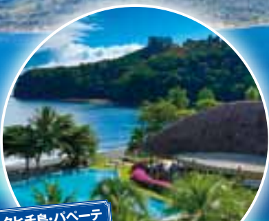
タヒチ島・バベテ