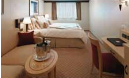
オーシャンビュー 約17㎡(シャワー付)