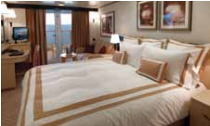
バルコニー 約21㎡(シャワー付)