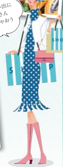
旅の思い出にたくさん買っちゃおう