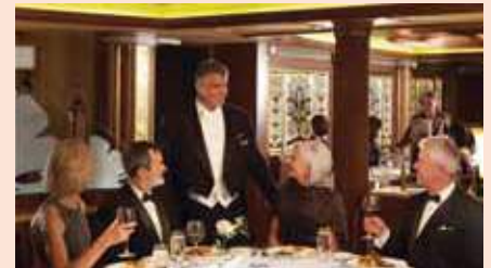
プリンセス・グリル