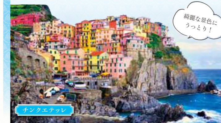
チンクエッテッレ