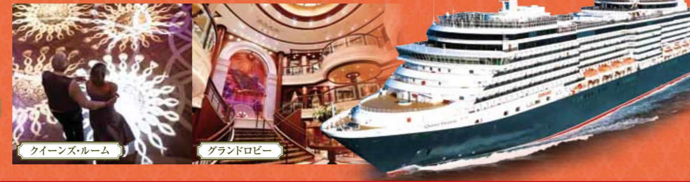
クイーンズ・ルーム グランドロビー