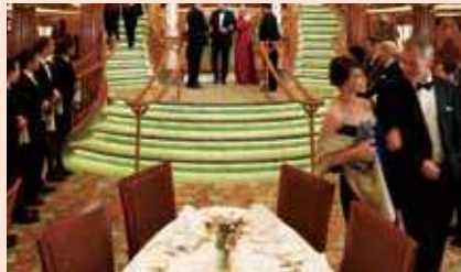
ブリタニア・レストラン