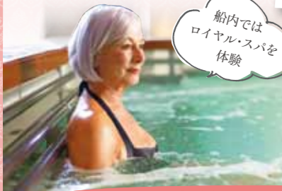
船内ではロイヤル・スパを体験

◀クイーン・ヴィクトリアのロイヤル・スパでエレミス・ペンシフィック・フェイシャルまたはスウェーデン式マッサージでお寛ぎください。(実施日は、お好きな日をお選びいただけます。) ※5月末までにお申込みの方のみ