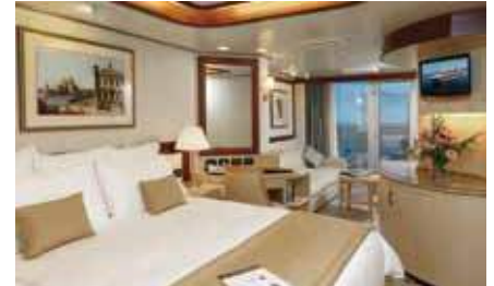
プリンセス・スイート 約31㎡(バスタブ付)