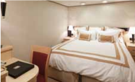
スタンダード内側 約14㎡(シャワー付)