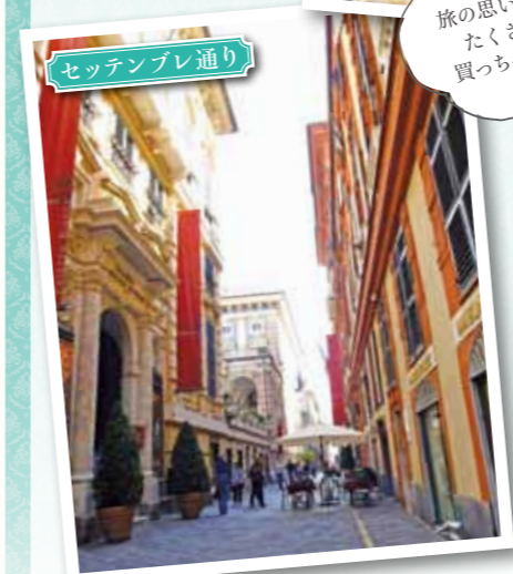
セッテンブレ通り

▶ヨーロッパのショッピングはデパートやショップだけでなく市場も一見の価値があります。