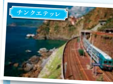
チンクエッテッレ

▲世界遺産にも登録されている美しい街です。キュートな電車で移動します。(※10/30ラ・スペツツァで船会社主催OPに参加した場合)