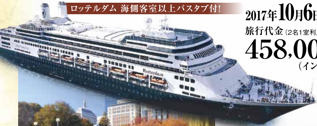
ボストン(アメリカ)

458,000円 ~ 838,000円 (インサイド) (ネプチューンスイート)