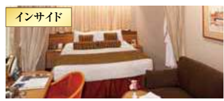
シャワー付き / 約17㎡