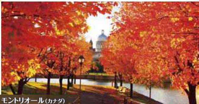
モントリオール(カナダ)