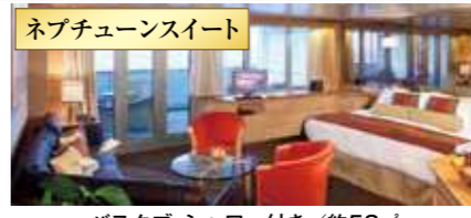
バスタブ・シャワー付き / 約53㎡