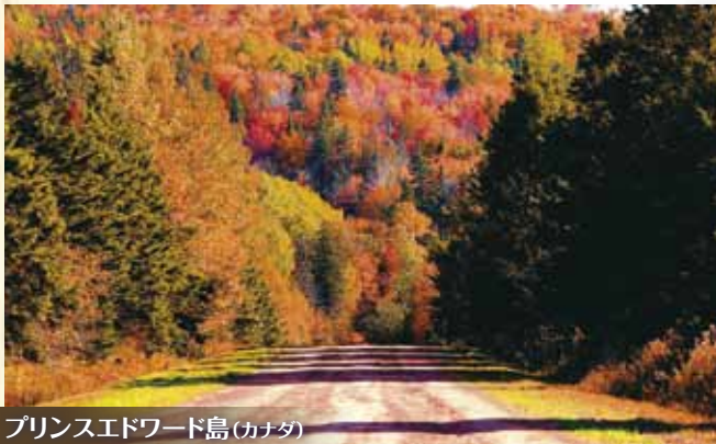
プリンスエドワード島(カナダ)