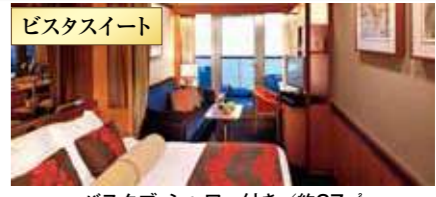
バスタブ・シャワー付き / 約27㎡