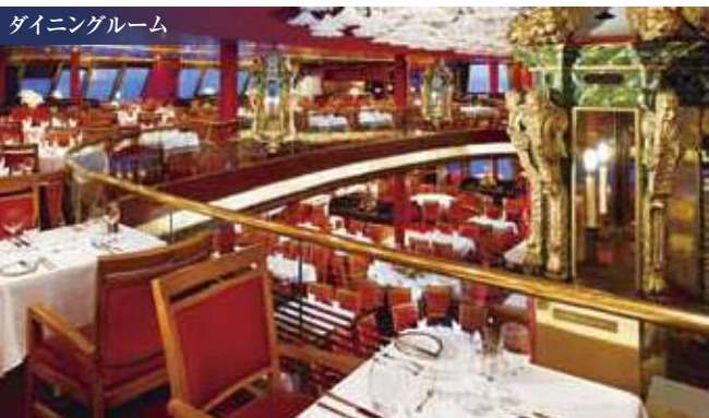
ダイニングルーム

船内には、ゆっくりと寛げるスパをはじめ華やかなショーを楽しめる2層吹き抜けショールームなど、多種多様なアクティビティを体験できます。