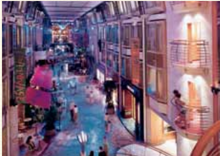
ロイヤルプロムナード