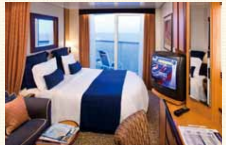
E3:デラックスバルコニー バルコニー・シャワー付(約15.2㎡+4.7㎡)