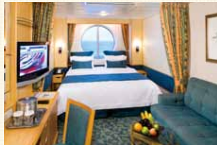
I:スタンダード海側 シャワー付(約14.8㎡)