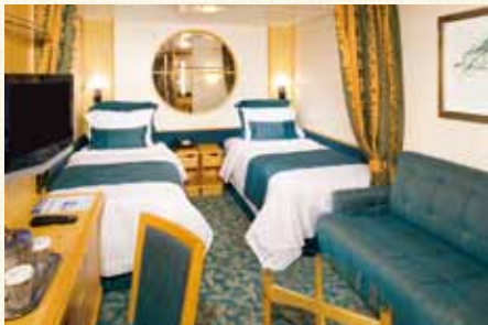
N:スタンダード内側 シャワー付(約13.9㎡)