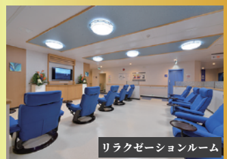
リラクゼーションルーム