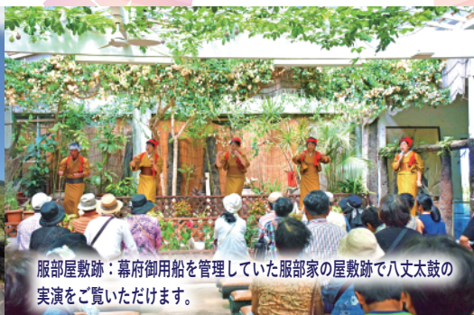
服部屋敷跡：幕府御用船を管理していた服部家の屋敷跡で八丈太鼓の実演をご覧ください。