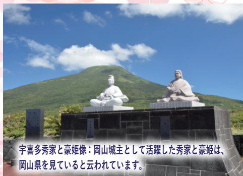
宇喜多秀家と豪姫像：岡山城主として活躍した秀家と豪姫は、岡山県を見ていると云われています。