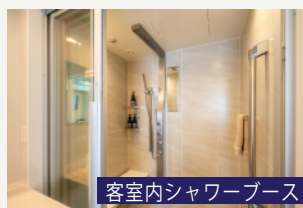
客室内シャワーブース