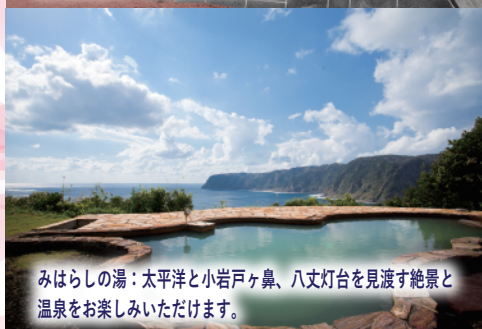
みはらしの湯：太平洋と小岩戸ヶ鼻、八丈灯台を見渡す絶景と温泉をお楽しみいただけます。