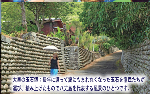
大里の玉石垣：長年に渡って波にもまれ丸くなった玉石を漁民たちが運び、積み上げたもので八丈島を代表する風景のひとつです。