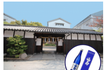
▲神戸酒心館と福寿

1934 年建築の旧琵琶湖ホテルを保存改修し 2002 年に誕生。歌舞伎座などの設計で名高い故岡田信一郎によるもので、昭和天皇やヘレン・ケラーなどの著名人が宿泊。