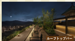
ルーフトップバー

2026年3月5日(木)に開業する帝国ホテル 京都の貴重な客室を確保しました。この機会に巨頭と祇園の地で日本が世界に誇る帝国ホテルのサービスをぜひ体感ください。