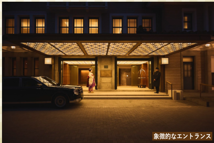
象徴的なエントランス