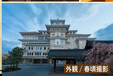
外観 / 春頃撮影