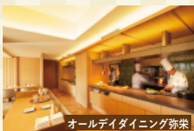
オールデイダイニング弥栄