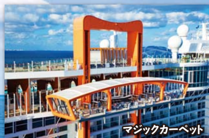
マジックカーペット