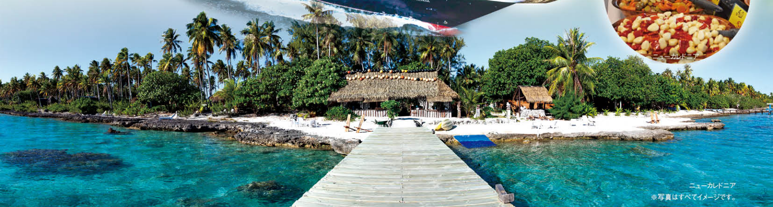
イル・デ・パン島