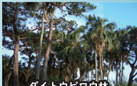
ダイトウビロウ林

島の人々が大事に保護してきた神が降りるとされる聖木。昭和56年に村の天然記念物に指定されています。