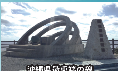
沖縄県最東端の碑

島の人々が大事に保護してきた神が降りるとされる聖木。昭和56年に村の天然記念物に指定されています。