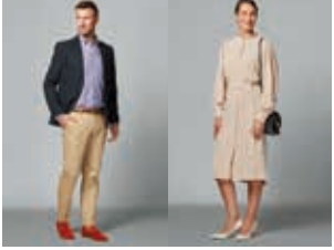
男性 ジャケットの着用をおすすめします(ネクタイなしでも可) 女性 カクテルドレス、スタイリッシュなスーツ、ワンピース など