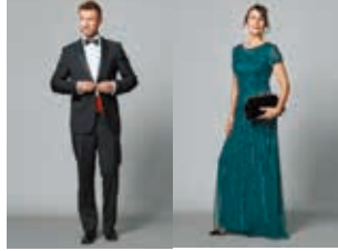
男性 タキード、ディナージャケット、ダークスーツにネクタイ など 女性 イブニングドレス、カクテルドレス、着物 など