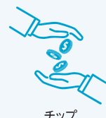
チップ 「クルー・アプリ シエーション」※4