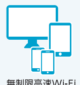
無制限高速Wi-Fi メダリオン・ネット (1名4デバイス) ※3