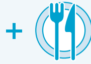
通常有料の カジュアル・ダイニング (クルーズ中2回まで)