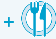
通常有料の カジュアル・ダイニング(無制限)、 スペシャルティ・レストラン 2回無料 ※5