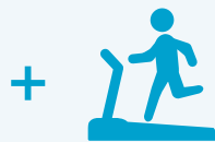
船内アクティビティ