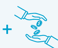
チップ 「クルー・アプリ シエーション」※4