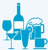
プラス・ビバレッジ・パッケージ ※2 15米ドルまでの対象ドリンク (ソフトドリンク、スピリッツ50種類、グラスワイン25種類、ビール25種類)