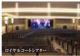
ロイヤルコートシアター