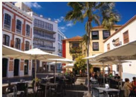
ラ・パルマ島(スペイン/カナリア諸島)

7つの丘に広がるポルトガルの首都で、その高低差が美しい景色を作り出しています。歴史的な街並みが残り、ジェロニモス修道院やベレンの塔など観光名所も豊富にあります。