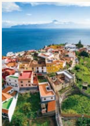
テネリフェ島(スペイン/カナリア諸島)

16世紀の大航海時代に栄えた重要な寄港地で、一年を通じて温暖な気候です。歴史地区にはポルトガル様式の建物が立ち並び、マデイラワインも有名です。