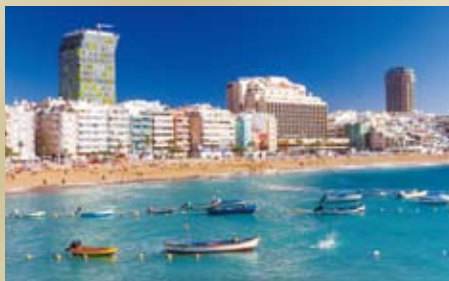
グラン・カナリア島(スペイン/カナリア諸島)

100を超える火山の噴火により、溶岩台地と300以上のクレーターが見られる様は月面のようなです。火山性の土地を利用したワインや地熱を利用した料理などグルメも充実しています。