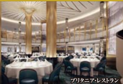
ブリタニア・レストラン