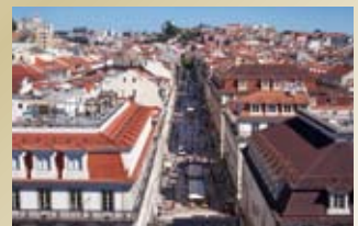
リスボン(ポルトガル)

7つの丘に広がるポルトガルの首都で、その高低差が美しい景色を作り出しています。歴史的な街並みが残り、ジェロニモス修道院やベレンの塔など観光名所も豊富にあります。