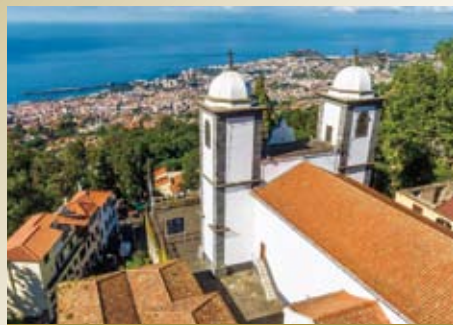
フンシャル(ポルトガル/マデイラ島)

16世紀の大航海時代に栄えた重要な寄港地で、一年を通じて温暖な気候です。歴史地区にはポルトガル様式の建物が立ち並び、マデイラワインも有名です。