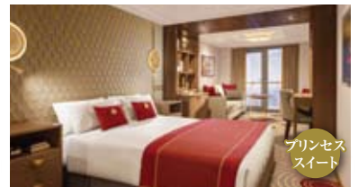
プリンセス スイート