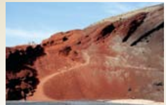
ランサローテ島(スペイン/カナリア諸島)

島の中央部にカルデラが広がる、深い峡谷や森が連なる自然豊かな島で、旧市街にはカラフルなコロニアル様式の家が並びます。