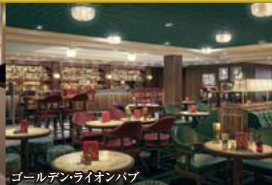
ゴールデンライオンパブ