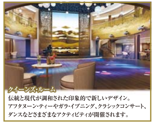
クイーンズ・ルーム

伝統と現代が調和された印象的で新しいデザイン。アフタヌーンティーやガラ・ライブニング、クラシックコンサート、ダンスなどさまざまなアクティビティが開催されます。