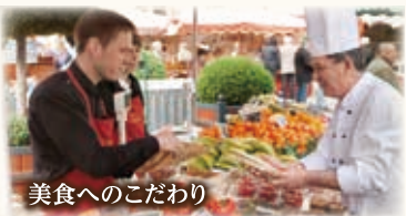
美食へのこだわり

ユニワールドは「浮かぶ美術館」と呼ばれ、本物の美術品やアンティークの高級家具・調度品を配置し、1隻1隻個性を持ってデザインされ、同じ船は一つとしてありません。ハイレベルなスタッフが気持ちのこもったサービスとアットホームな雰囲気です。S.S. ベアトリスはまるで心地よい我が家のような雰囲気です。英国サボワール社の職人が手作りでベッド、高級エジプト綿シーツ、選べる枕、ミネラルウォーターもご用意。バスアメニティはすべてアスプレイです。