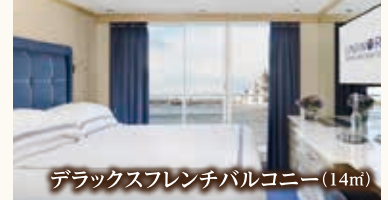
デラックスフレンチバルコニー (14㎡)