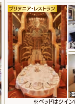
ブリタニア・レストラン