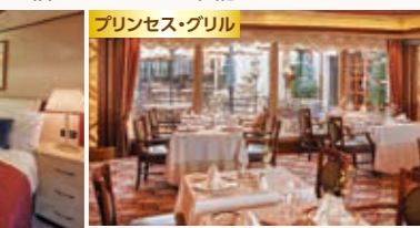
プリンセス・グリル