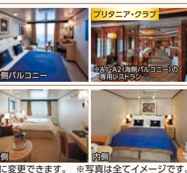
ブリタニア・クラブ