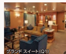
グランドスイート(Q1)

各客室クラスに異なるメイン・ダイニングルームをご用意しております。広々としてスタイリッシュなダイニングで至福のひとときをご堪能ください。