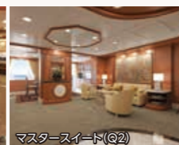
マスタースイート(Q2)