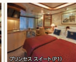
プリンセススイート(P1)