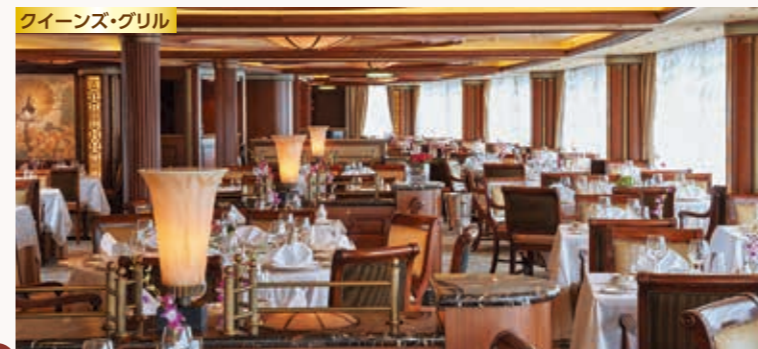
クイーンズ・グリル