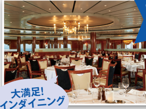
大満足! メインダイニング ルーム