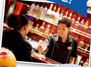
豊富にある カジュアルな カフェやバー