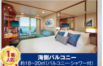
海側バルコニー 約18~20m(バルコニーシャワー付)