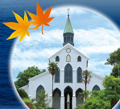
長崎 / 大浦天主堂 (イメージ) 写真掲載については長崎大司教区の許可をいただいています。