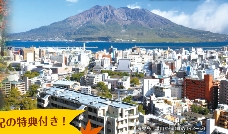
鹿児島 / 城山からの眺め (イメージ)