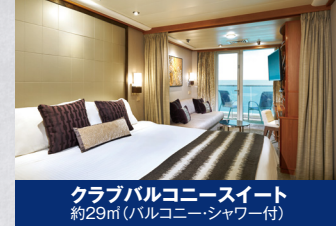
クラブバルコニー 約29m(バルコニーシャワー付)