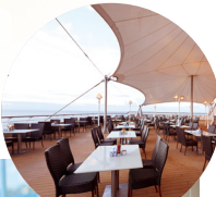
レストランの一例

気軽な雰囲気ですドレスコードもありません。 ユニークなコンセプトのアクティビティも満載。 アメリカ客船ならではの迫力満点のショー、 カジノ、スパなど船上での楽しみがいっぱいで、 まるで洋上に浮かぶリゾートホテルです。