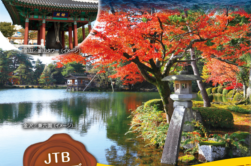
金沢 / 兼六園 (イメージ)