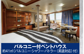
バルコニー付ベントハウス 約41m(バルコニーシャワー付)

● 共通のご注意 ※旅行代金は2名様1室ご利用のものとなります。※3-4名1室利用はリクエスト手配となります。※3-4人目のお客様は全客室お1人様につき30,000円となります。※バルコニー付きキャビンの場合、キャビンの広さ表示はバルコニーを含みます。クラブバルコニースイートおよびバルコニー付ベントハウスはリクエスト手配となります。※発着時間・寄港地は場合によって変更となる場合があります。※旅行(パスポート)の残存有効期間は旅行最終日から6ヶ月必要となりますのでご注意ください。※現地通貨:日本円、韓国ウォンとなります。※船内通貨:USDとなります。別途必要代金(お1人様あたり) 【入港諸税】30,000円(10/27、11/28出発)、27,000円(11/8、11/18出発) 【政府関連諸税(国際観光旅客税)】20,000円(10/27、11/28出発)、17,000円(11/8、11/18出発) 旅行代金と合わせて、お申込販売店にお支払いください。【船内チップ】内側・クラブバルコニースイート:1泊/15.5USD、バルコニー以上:1泊/18.5USDを船内に各自ご精算いただけます。