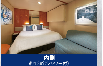
内側 約13m(シャワー付)