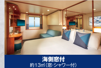
海側窓付 約13m(窓シャワー付)