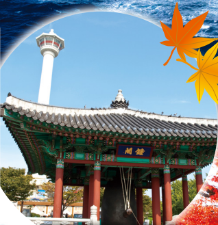
釜山 / 釜山タワー (イメージ)