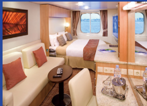
海側窓付 約15.7㎡(窓、シャワー付)