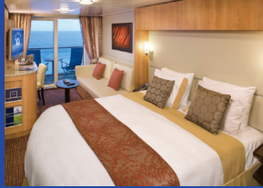
コンシェルジュラス 約21.5㎡(バルコニー、シャワー付)