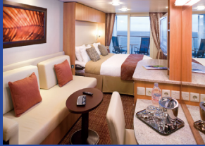
デラックスペランダ 約19.2㎡(バルコニー、シャワー付)