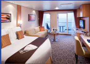
アクアクラス 約23.0㎡(バルコニー、シャワー付)