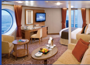
スカイスイート 約28.5㎡(バルコニー、バス付)