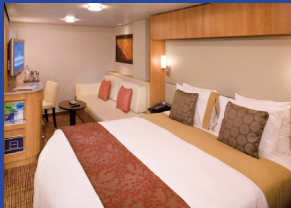
内側 約15.7㎡(シャワー付)