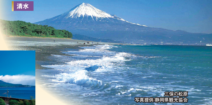
三保の松原