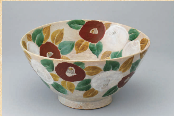
北大路魯山人「椿鉢」昭和15年(1940)頃 足立美術館蔵