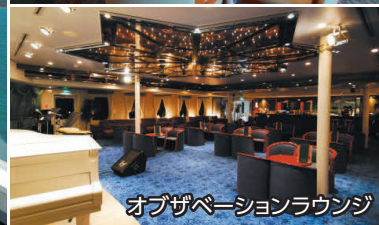
オブザベーションラウンジ