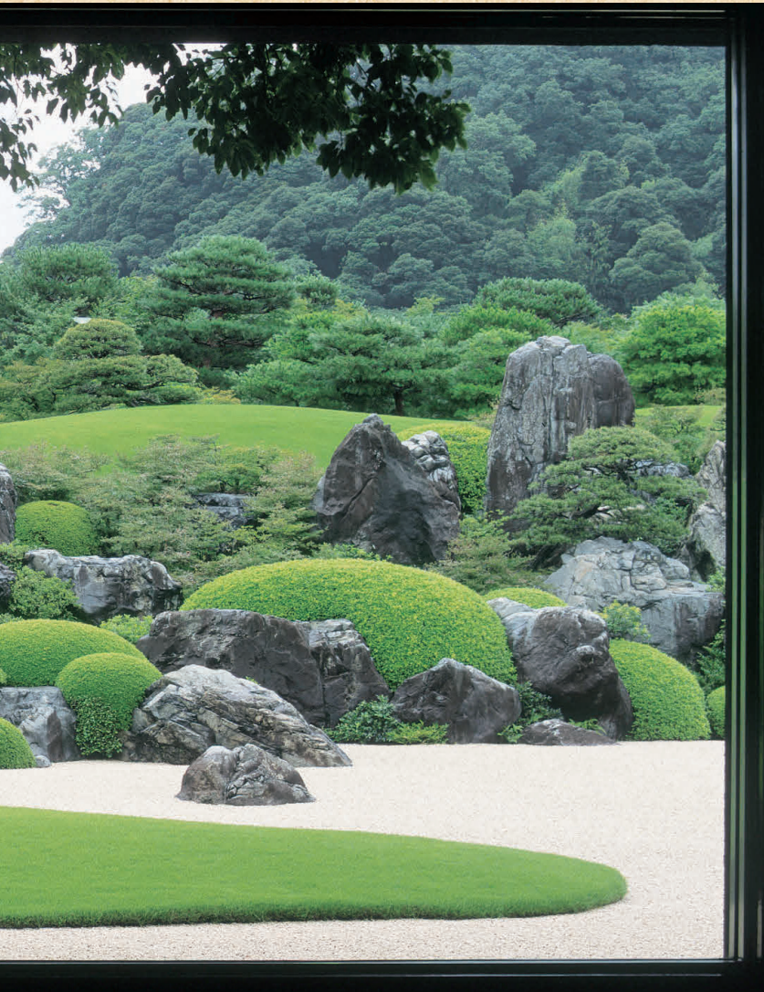
窓がそのまま「生の額縁」に! 「生の額絵」