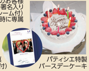
記念写真 (特製フォトフレーム付)

クルーズ中に誕生日をお迎えのお客様にはパティシエ特製バースデーケーキと記念写真を、ハネムーンや結婚記念日、金婚式(50周年)、エメラルド婚式(55周年)、ダイヤモンド婚式(60周年)、ブルースターサファイア婚式(65周年)、プラチナ婚式(75周年)の結婚記念の年にご夫婦でご乗船のお客様には記念写真(船長の署名入りカード・特製フォトフレーム付)をプレゼント。ご夕食時に専属バンドの生演奏で特別な日に華を添えます。 ※クルーズお申し込み時に旅行会社にお申し出ください。