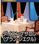
ダイニングサロン (グラス・シエクル)

◆専用ダイニングで専属シェフによる特別なメニューとぎめ細やかなサービスでおもてなし。二人掛けテーブルでゆったりとお食事をお楽しみいただけます。 ※ダイニングサロンは未就学児童の方はご利用いただけません。 ◆乗船日にはお部屋にウェルカムスイーツをお届けします。