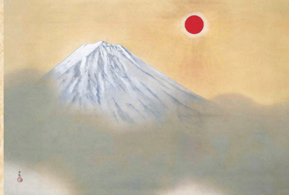
横山大観「乾坤輝く」昭和15年(1940) 足立美術館蔵