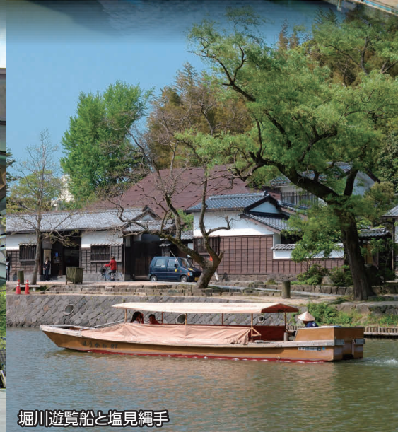
堀川遊覧船と塩見縄手