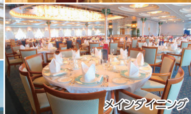
メインダイニング