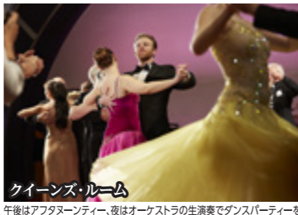
クイーンズ・ルーム 午後はアフタヌーンティー、夜はオーケストラの生演奏でダンスパーティーを。