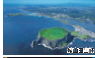
濟州島 / B・C・E

「韓国のハワイ」とも呼ばれる濟州島は韓国国内でも人気のリゾートアイランドです。海底噴火によってできた城山日出峰は世界遺産に指定されています。