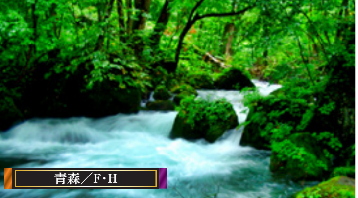
青森/F・H 十和田湖から流れ出る奥入瀬川。岩や樹林をかき分け、十和田湖畔から焼山まで約14km続く流れが奥入瀬渓流です。特別名勝、天然記念物として国の指定を受け保護されており、滝や清流、岩など、たくさんの見所があります。

E 5月18日発コース F 5月25日発コース G 9月22日発コース H 10月1日発コース I 10月10日発コース