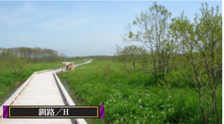
釧路/H 釧路湿原は、釧路川とその支流を抱く日本最大の湿原で、その面積は東京の都心と同じほど広大です。約700種の植物、200種の鳥類など、確認されただけでも1,150種の昆虫が生息しています。特別天然記念物に指定されているタンチョウなどの水鳥をはじめ、多くの野生生物の貴重な生息地となっています。