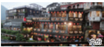
基隆 / D

台湾一の港街基隆から約1時間、赤い提灯が並ぶ幻想的な光景「九份」。日本人観光客に大人気の観光地のひとつです。また基隆市内には基隆廟口夜市など台湾の屋台がたくさん並んでいます。