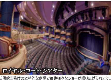
ロイヤル・コート・シアター 3層吹き抜けの本格的な劇場で毎晩様々なショーが繰り広げられます。