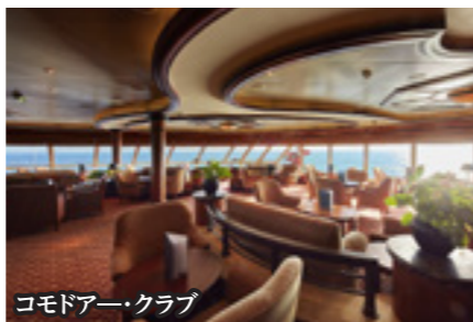
コモドアー・クラブ 船長の中から選ばれる最高位の称号を冠したラウンジ