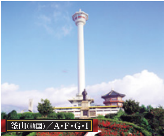
釜山(韓国) / A・F・G・I

A 4月14日発コース B 4月23日発コース C 5月2日発コース D 5月9日発コース E 5月18日発コース F 5月25日発コース G 9月22日発コース H 10月1日発コース I 10月10日発コース