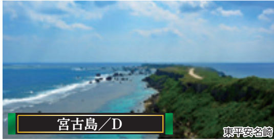
宮古島 / D

日本から最も近い外国として日本人にも馴染み深く、世界遺産でもある慶州への拠点として多くの観光客が訪れます。