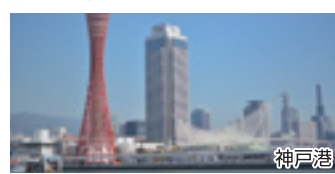
神戸 / A

神戸南京町は日本三大中華街のひとつで人気観光エリア。近くには神戸海洋博物館もあります。ポートタワーの風景は港町に相応しい雰囲気です。