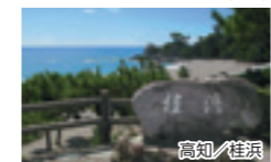
●食事条件: 朝食9回、昼食8回、夕食9回