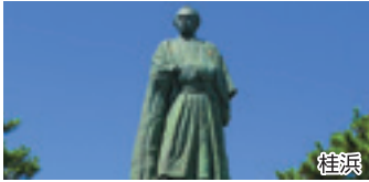
高知

高知といえば坂本龍馬と桂浜、土佐の闘犬が有名です。高知市の中央にそびえる土佐24万石のシンボル高知城は、山内一豊によって築城されました。現在は一帯が高知公園として開放されています。