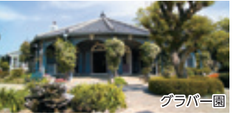
※写真は全てイメージです。

歴史的経緯から長崎はキリスト教徒の数が比較的多く、日本最古の現存するキリスト教建築物として大浦天主堂は2018年に世界文化遺産に登録されました。また大浦天主堂、グラバー園は港から徒歩圏内に位置します。