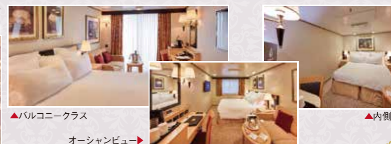
▲バルコニークラス