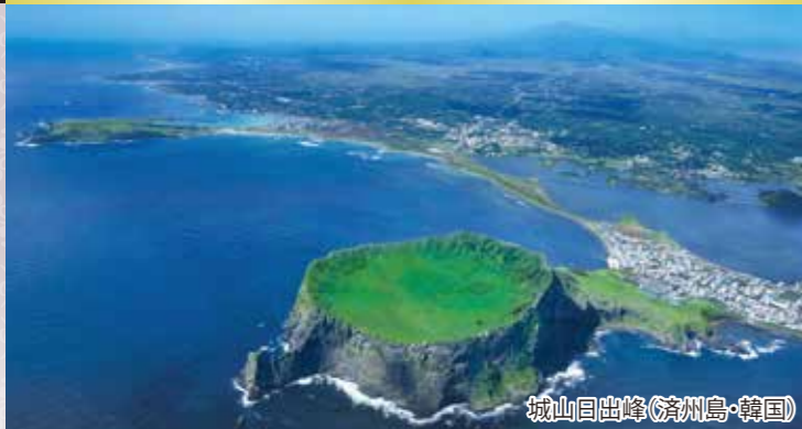
城山日出峰(濟州島・韓国)

春の山陽、九州、四国の各地をめぐり、韓国のリゾート地で知られる濟州島を巡る2020年クイーン・エリザベス横浜発着クルーズの最初のクルーズです。終日航海も3日間あり、船内でもゆっくりお過ごしいただくことができます。